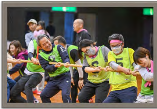
個々のちがいを超えて作用しあう運動会