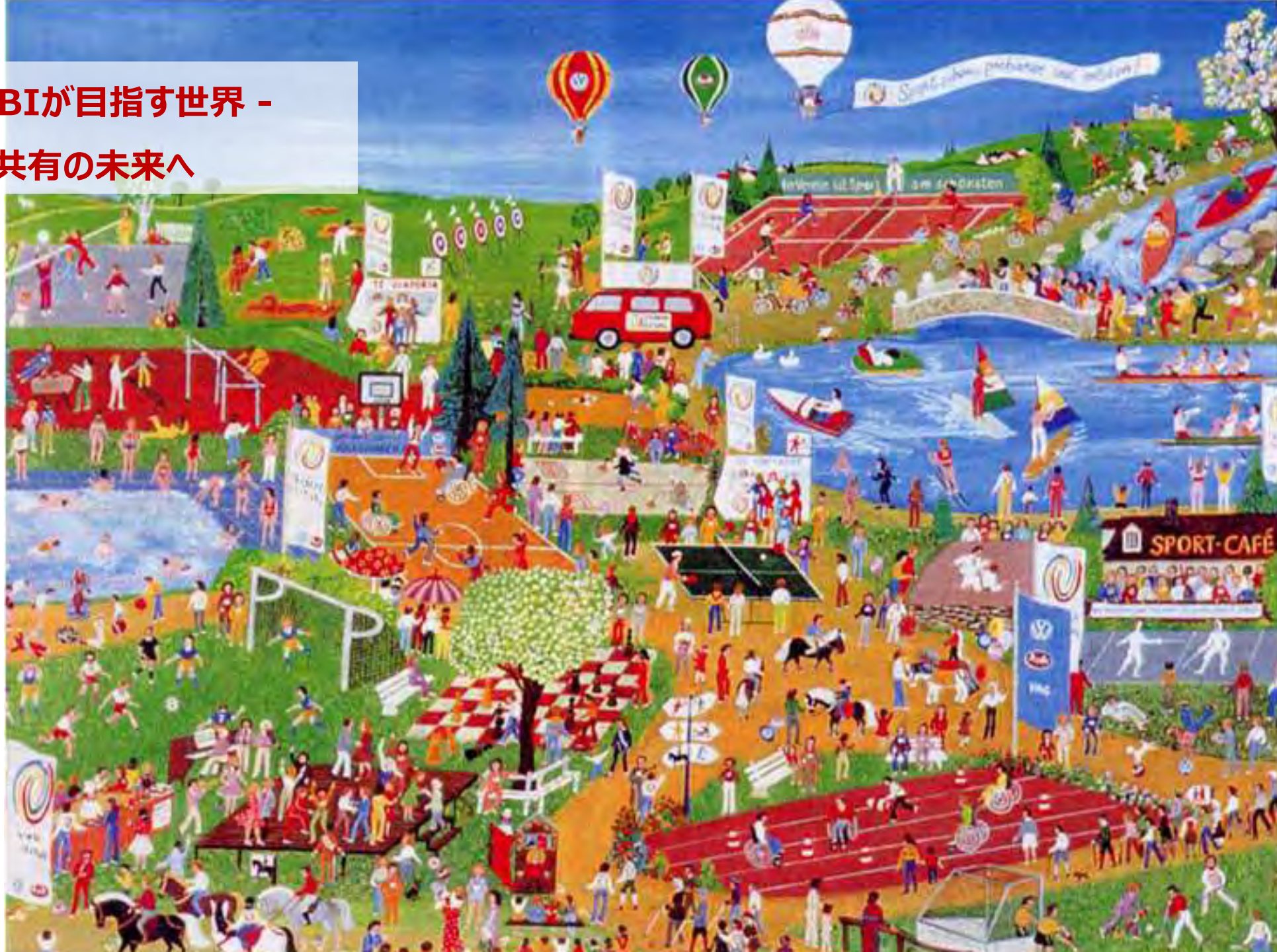
1975年 ドイツ スポーツフォーオール 帝京大学 谷本都栄先生ご提供