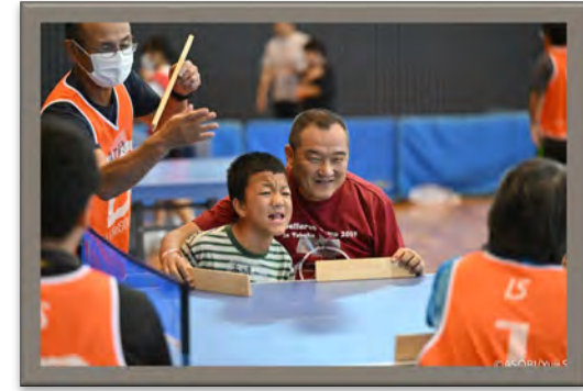
スポーツに触れる機会を障がい等にかかわらず全ての人に提供できる人材の育成