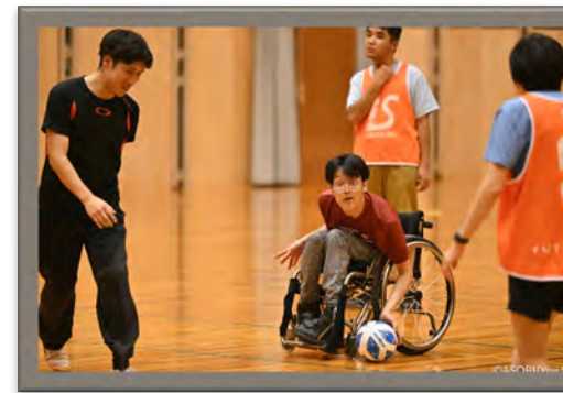
スポーツに自由とアイデアを！ 手法の可能性を広げてまぜこぜで楽しめるスポーツを普及