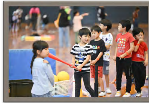
精神科作業療法士の視点で「ちがい」があってもちがいによる不便さを感じない環境を社会に一般化させる