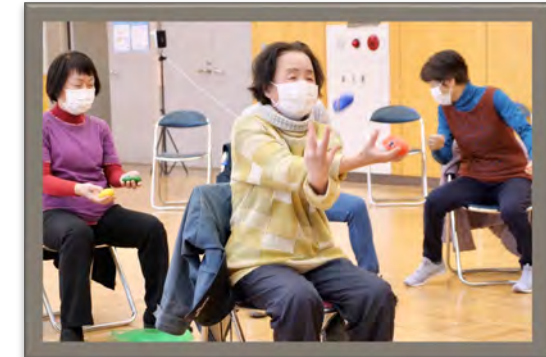
ドイツ生まれの脳トレで心身の元気を 「Re+クリエイション」（＝元気を再び生み出す）